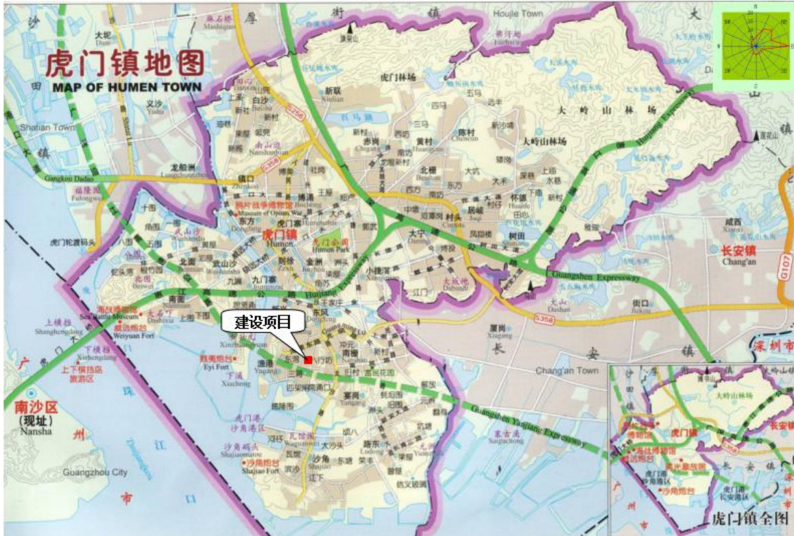
图 3-1 厂区地理位置图

东莞市鑫瑞凯塑胶制品有限公司位于东莞市虎门镇南栅文明路十二巷 8 号 3 栋 201 室，地理位置见图 3-1，厂区平面布置及监测点位图见图 3-2。