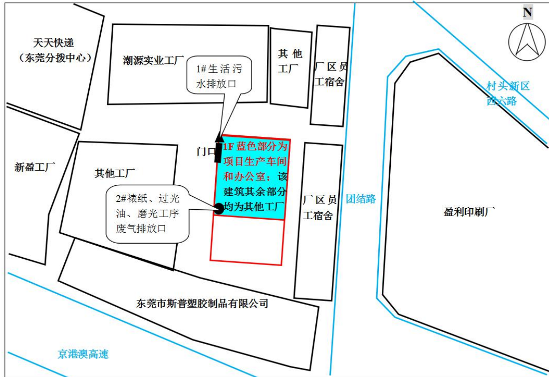
图3-1 厂区平面布置及监测点位