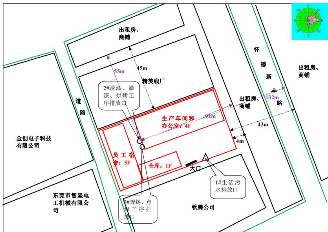
图3-1 厂区平面布置及监测点位