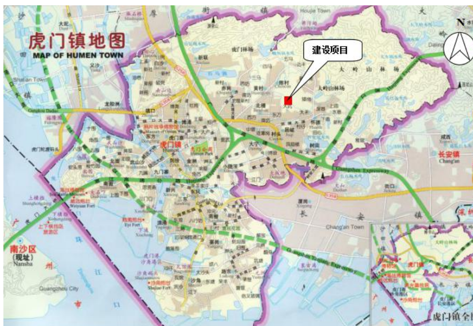
图 3-1 厂区地理位置图

东莞市虎门三龙纸品加工厂位于东莞市虎门镇怀德社区大坑沙场 101 厂房（地理坐标：N22°50'34.02"，E113°43'30.96"），地理位置见图 3-1，厂区平面布置及监测点位图见图 3-2。